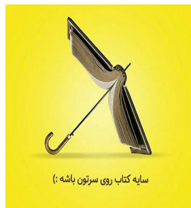
سایه کتاب روی سرتون باشه :